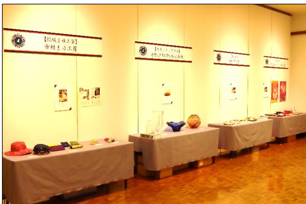
②前回の様子（場所：ザ・ヒロサワ・シティ会館 日時：令和4年12月16日～22日）